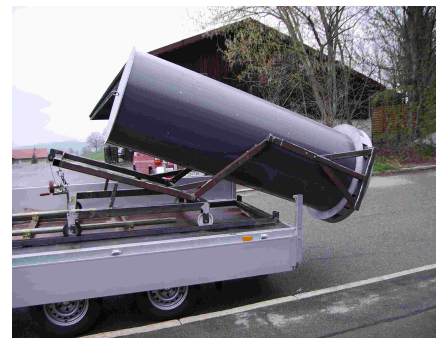
Transportwagen mit Kippvorrichtung zur Positionierung der Säule